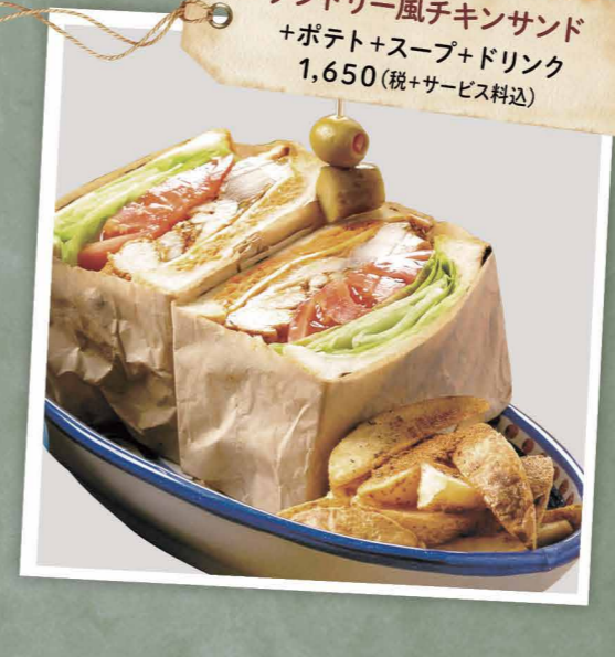
タンドリー風チキンサンド +ポテト+スープ+ドリンク 1,650 (税+サービス料込)