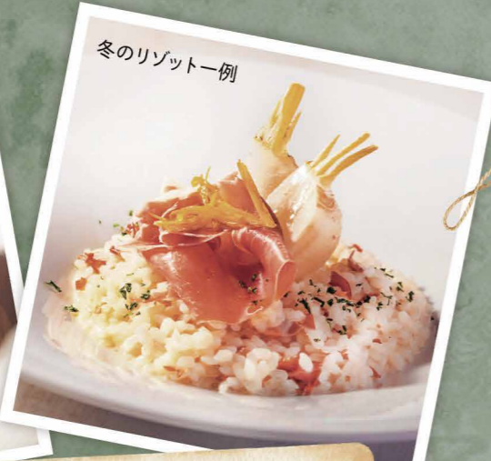
冬のリゾット一例