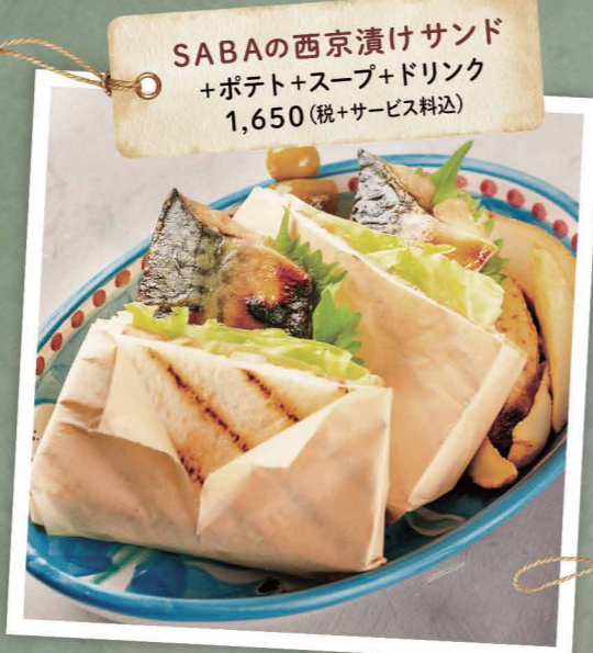
SABAの西京漬サンド +ポテト+スープ+ドリンク 1,650 (税+サービス料込)