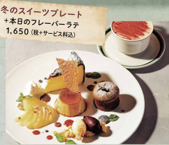
冬のスイーツプレート +本日のフレーバーラテ 1,650 (税+サービス料込)