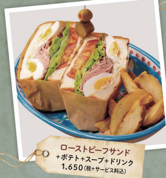
ローストビーフサンド +ポテト+スープ+ドリンク 1,650 (税+サービス料込)