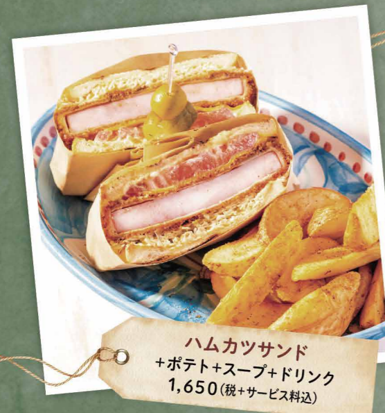
ハムカツサンド +ポテト+スープ+ドリンク 1,650 (税+サービス料込)

写真はイメージです。食材等の都合により変更になる場合があります。 車両の運転を予定されているお客様および20歳未満のお客様への 酒類の提供はできません。